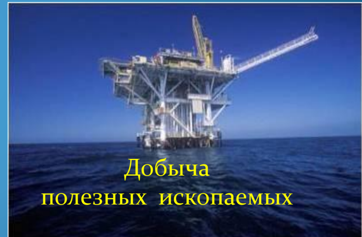
Добыча полезных ископаемых