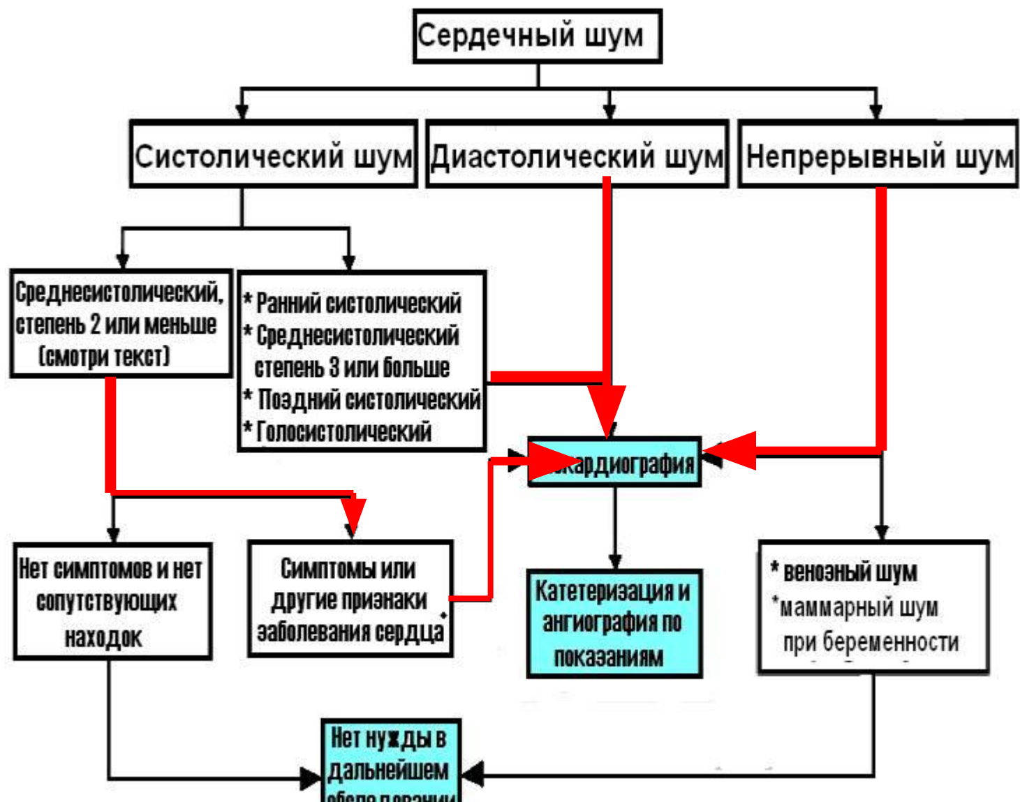
Рис . Алгоритм оценки сердечных шумов. *Эхокардиография показана, если есть патологические изменения на рентгенограмме органов грудной клетки или на ЭКГ.