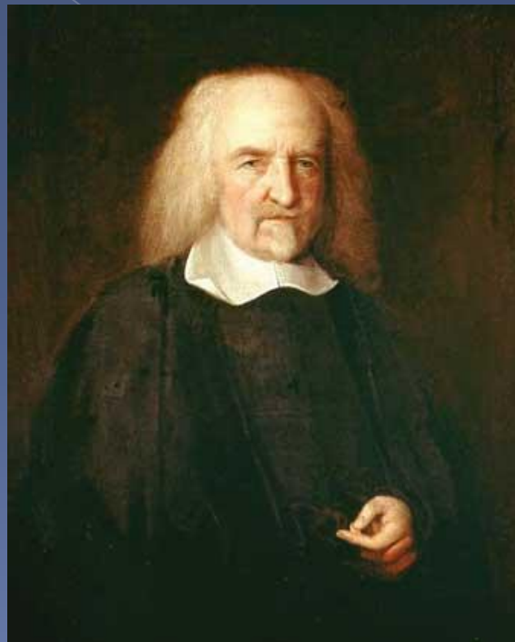
Джон Локк (1632-1704)