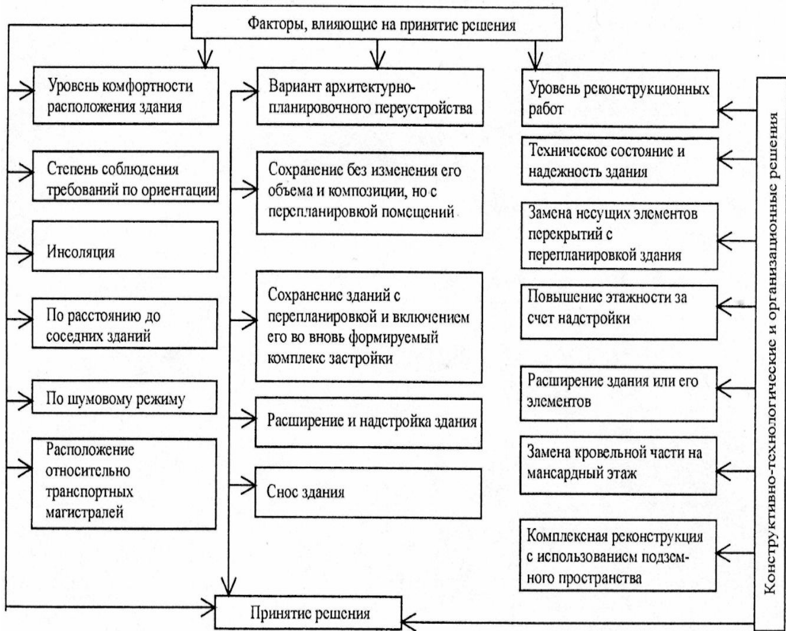
Факторы, влияющие на принятие решения по реконструкции отдельно взятого объекта