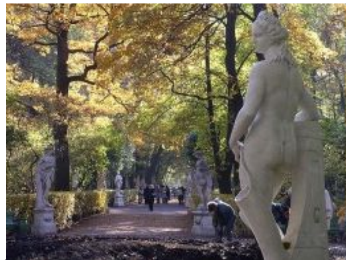
Летний сад в Петербурге