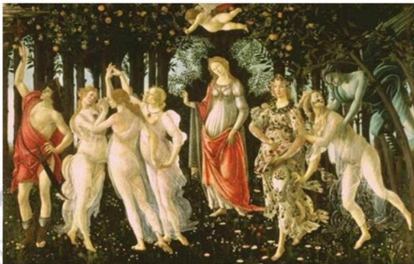
С. Боттичелли. Весна

ПЕРВЫЙ КОНЦЕРТ В ЦИКЛЕ КОНЦЕРТОВ «ВРЕМЕНА ГОДА» АНТОНИО ВИВАЛЬДИ (1678-1741) — НАИБОЛЕЕ ПОПУЛЯРНОМ СОЧИНЕНИИ ИТАЛЬЯНСКОГО КОМПОЗИТОРА В СТИЛЕ БАРОККО.