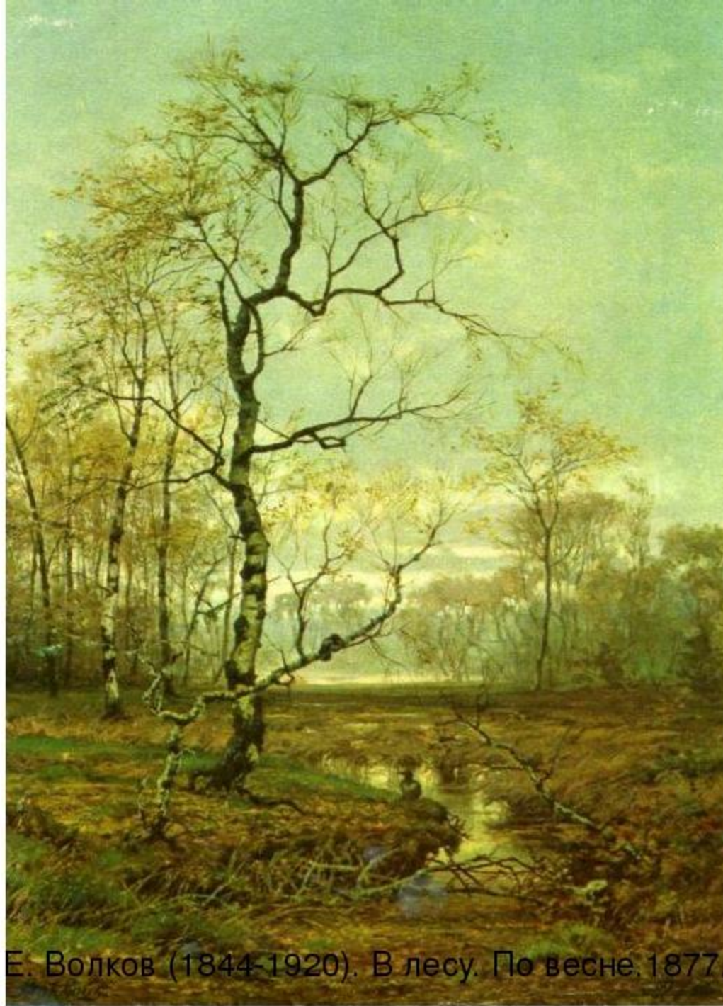
Е. Волков (1844-1920). В лесу. По весне. 1877.