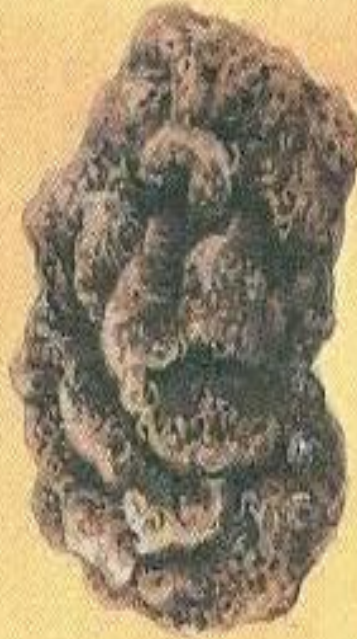
Бомба в виде цветной капусты