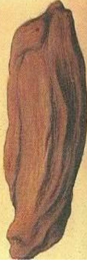
Бомба в виде коровьей лепешки