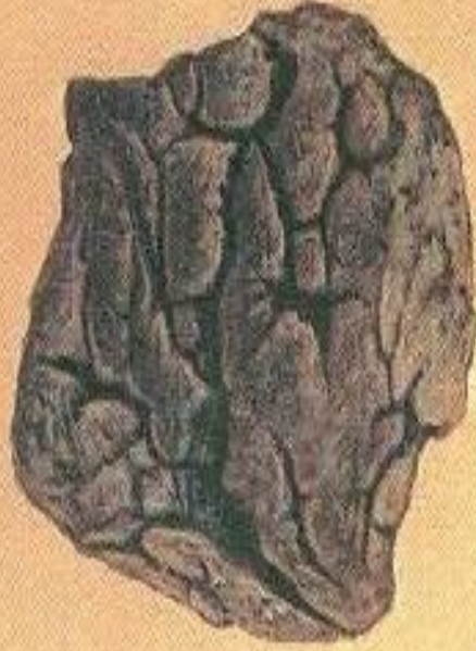
Бомба в виде хлебной корки