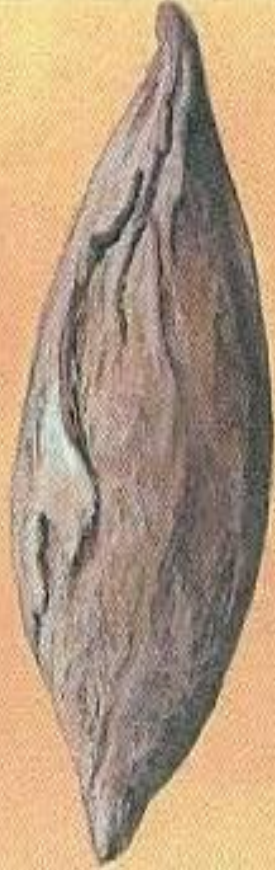
Бомба в форме веретена