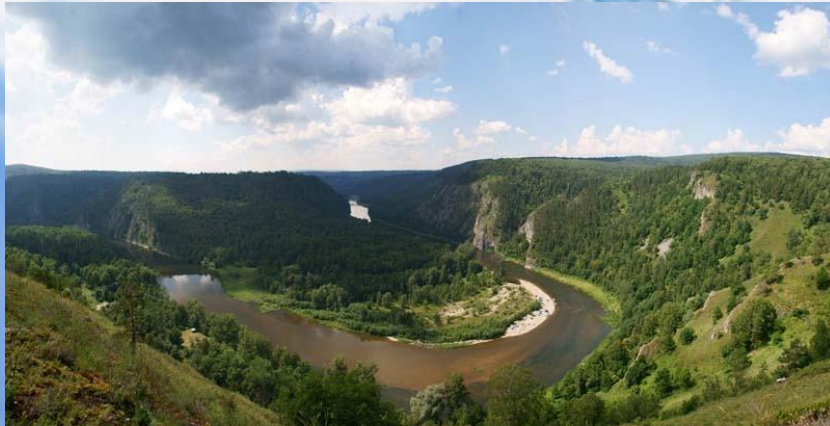
Природный заповедник "Шульган-Таш"