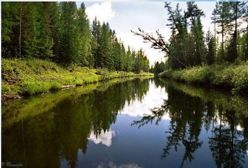
"Таруса" - заказник федерального подчинения