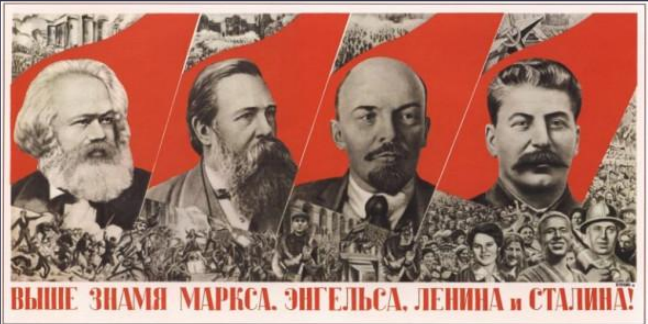
220. Клуцис Г. Выше знамя Маркса, Энгельса, Ленина и Сталина! 1936