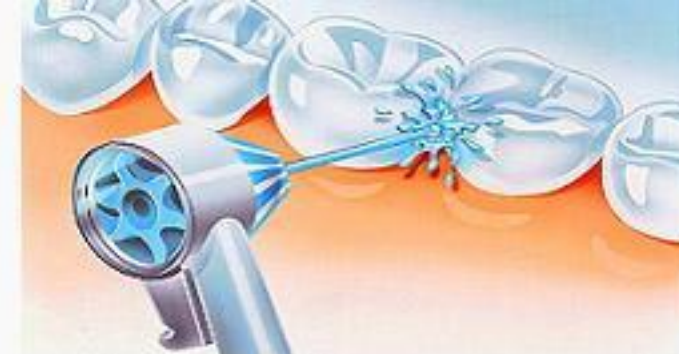
Снятие зубных отложений