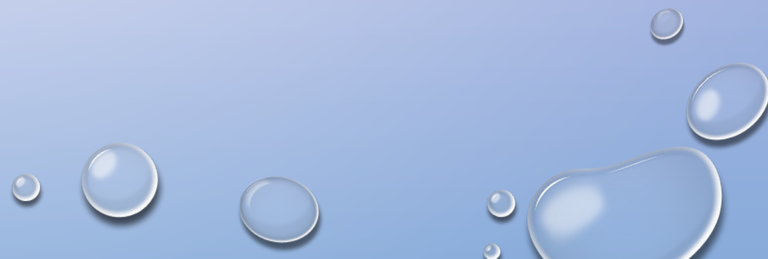
САНАЦИЯ ПОЛОСТИ РТА