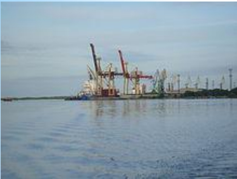
Морской порт Экономика

На территории порта Архангельск находятся 3 грузовых района: аванпорты Экономика и Бакарица (морской торговый порт) и морской речной порт (пассажирский). Через последний осуществляются рейсы на острова в черте города, а также на Соловецкие острова и другие населённые пункты. Основан с начала основания города.