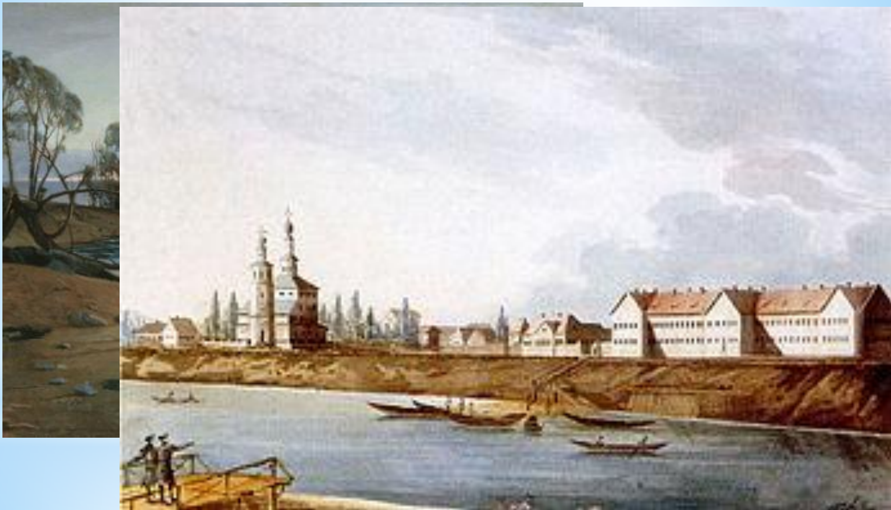
Вид города Архангельска в 1826 году. Часть набережной с церковью Святой Троицы. Картина русского художника В. Галямина

В 1693 году в первый приезд по указу Петра I на Соломбальском острове была заложена большая государева соломбальская судостроительная верфь.