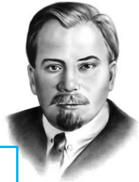
Олександр Олесь (1878—1944)