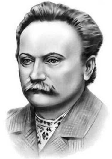
Іван Франко (1856—1916)