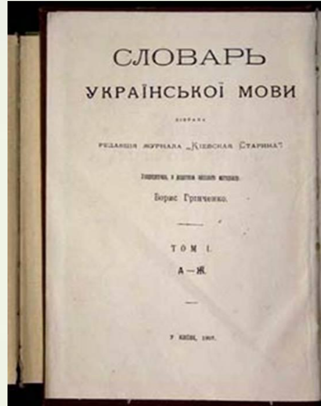
Словар Б. Грінченка