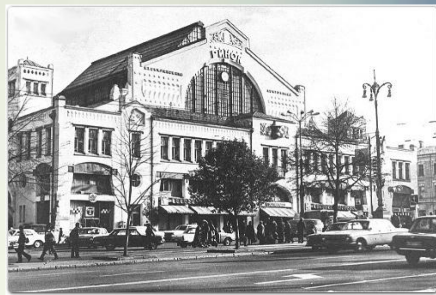
Бессарабський ринок, Київ