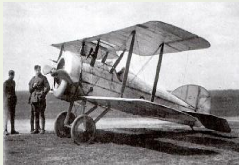
← Один із перших літаків, зроблених під керівництвом м М.Делоне