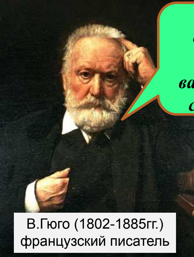
В.Гюго (1802-1885гг.) французский писатель

«Для меня не важно, на чьей стороне сила; важно то, на чьей стороне право».