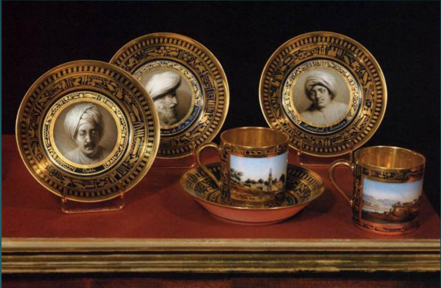
Сервский фарфор (Франция)