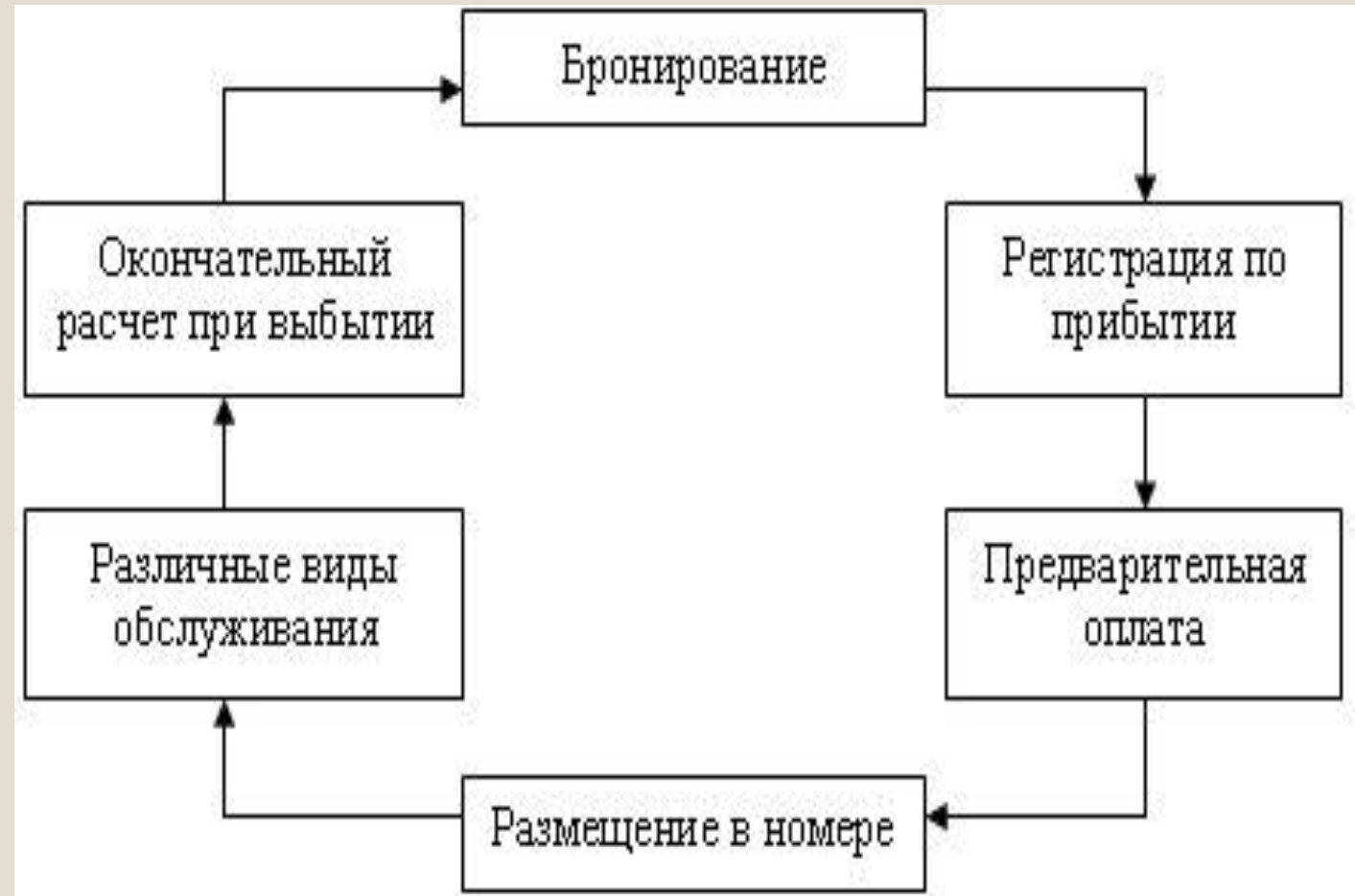
Технологический цикл обслуживания гостей