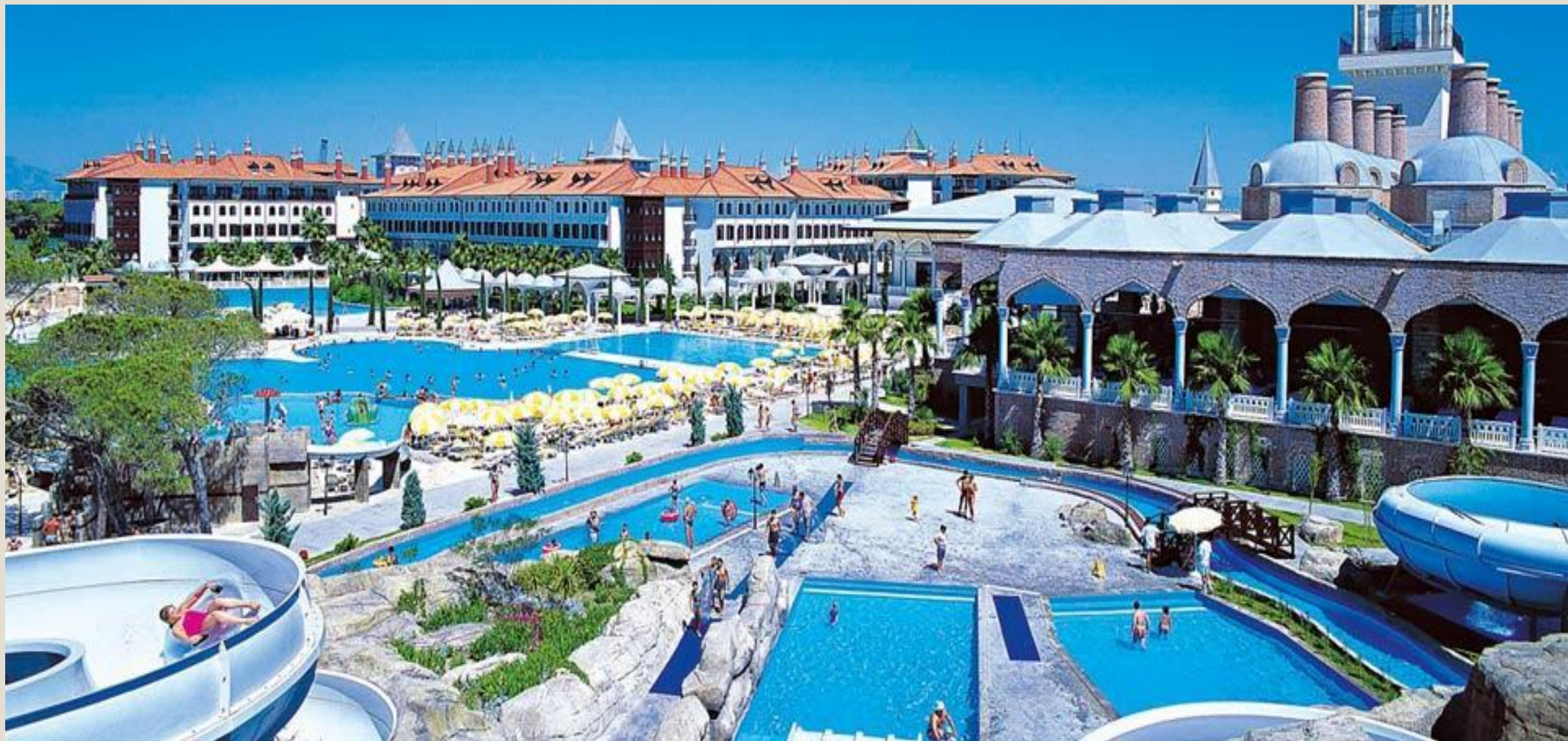
Отель Wow Торкарі Palace 5* (Турция, Анталия, Кунду)