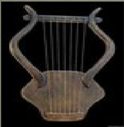
Виола да браччо