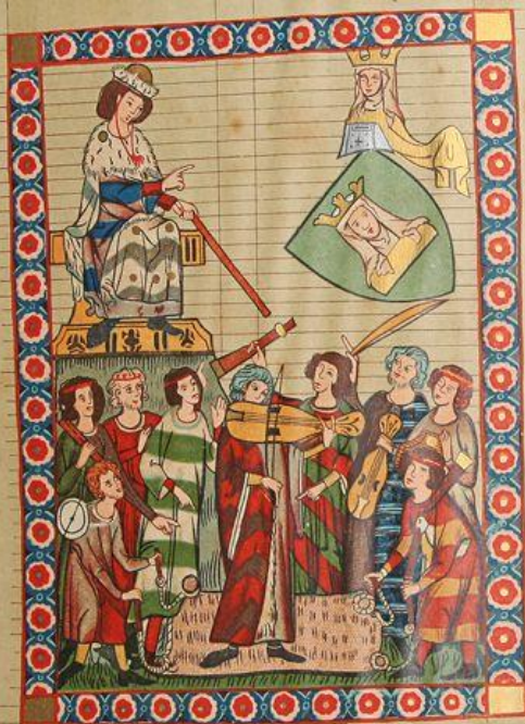
Мейстеръ Генрихъ Фрауэнлобъ. (Meister Heinrich Frauenlob—Henrich von Meissen). Факсимильная копия рукописи из геттингенской (Mansfelder) рукописной библиотеки.