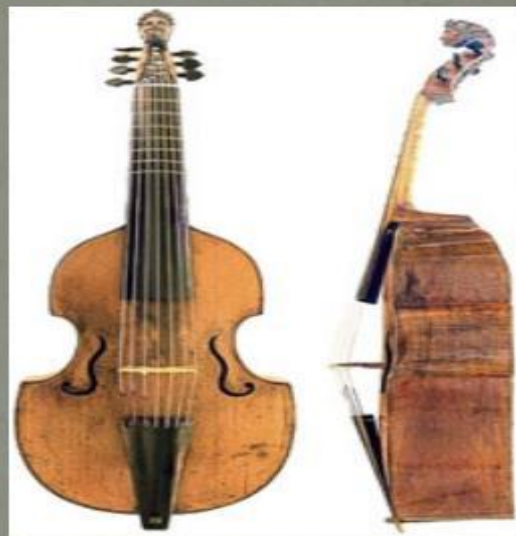
Виола да гамба