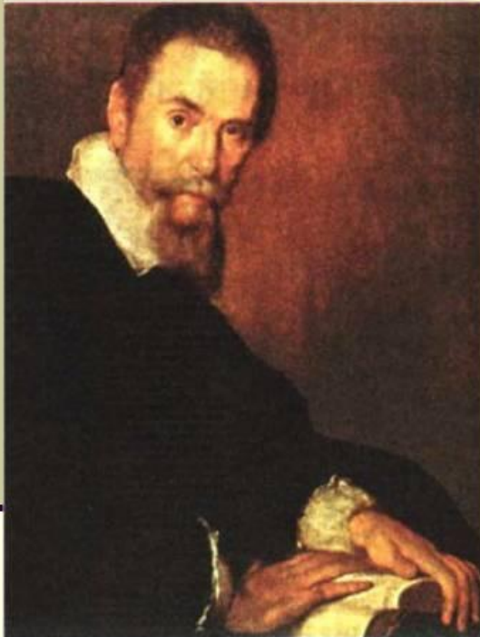
Б. Строщи. Портрет К. Монтеверди. Ок. 1640 г. Общество друзей музыки, Вена

Клаудио Монтеверди (1567-1643) - первый оперный композитор барокко и блестящий реформатор этого жанра. Он углубил содержательный смысл оперы, расширил выразительные средства и формы вокальных и оркестровых партий, ввёл в неё увертюру и дуэт. Главным его новшеством стал «взволнованный стиль» (concitato) , передающий драматизм и напряжённость действия, глубину страстных человеческих чувств и переживаний, создал мелодию, сочетающую в себе речевые интонации, декламацию и вокал. Он обогатил оперу полифонической традицией средствами музыки показал многообразие и противоречивость человеческих характеров.