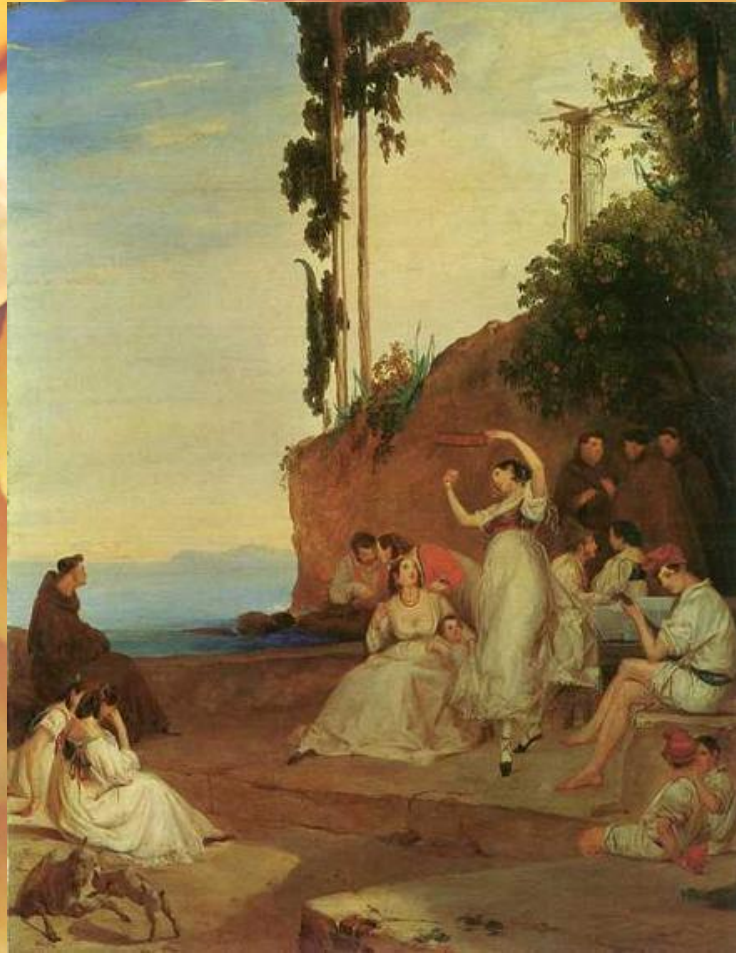
Карл Блехен Тарантелла 1835 г.