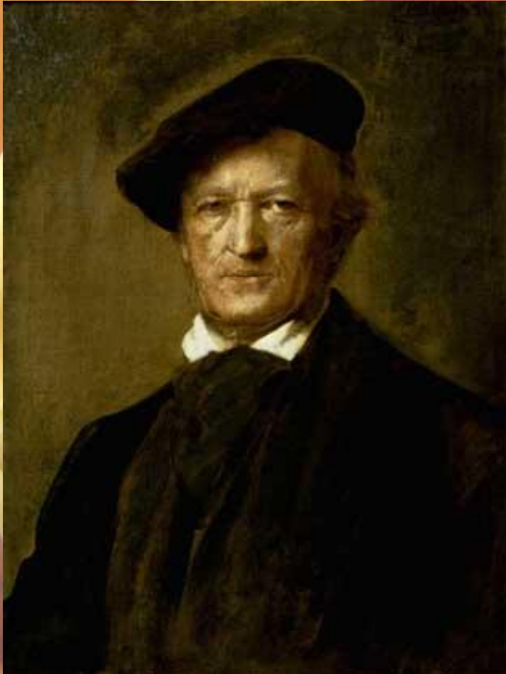
РИХАРД ВАГНЕР. Портрет работы Ф.Ленбаха