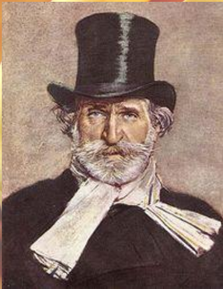
Джованни Больдини. Джузеппе Верди