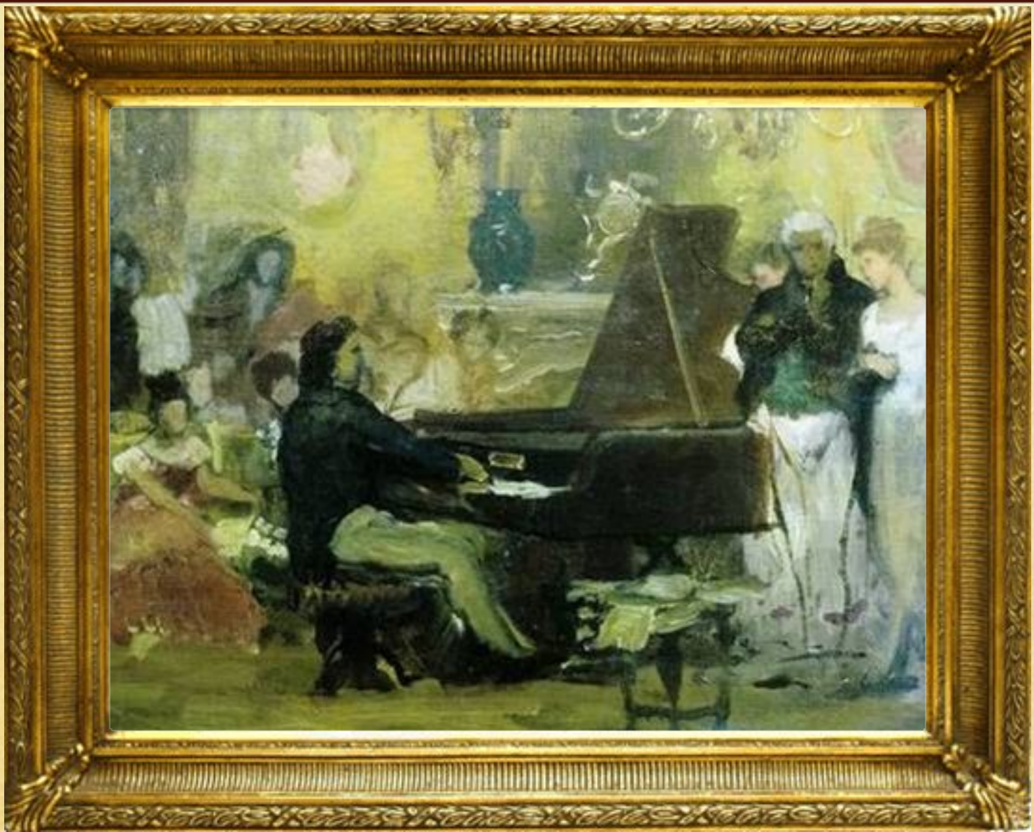
Генрих Ипполитович Семирадский (1845-1902) Россия Шопен в салоне князя Антона Радзивилла в Берлине в 1829 году