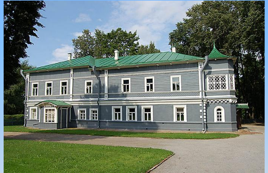
Зараз Дім-музей ім. Чайковського