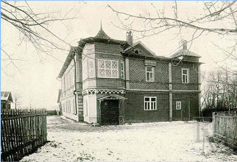
Дім П. І. Чайковського в Клину. 1893 рік.