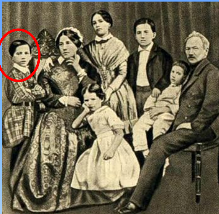
Сім'я Чайковських (крайній зліва — Петро Ілліч)

Народився 25 квітня 1840 в селищі Вятської губернії (нині місто Воткінськ, Удмуртія). Петро був другою дитиною в сім'ї.