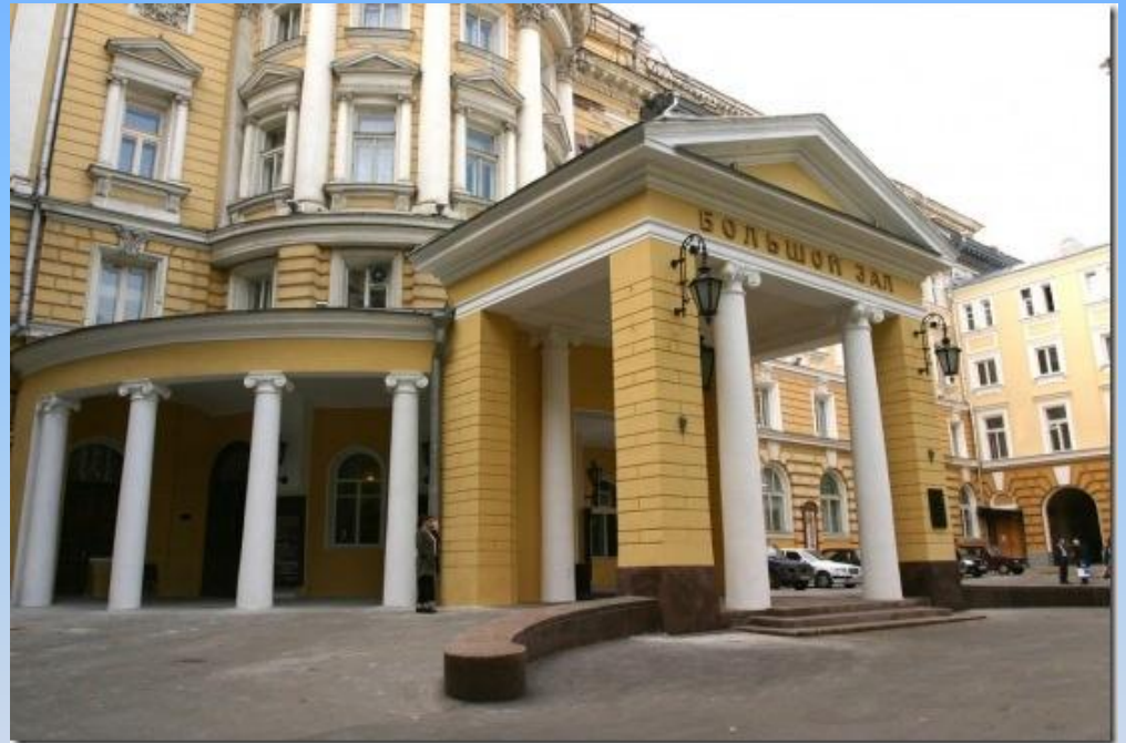
Театр, у якому працював Чайковський