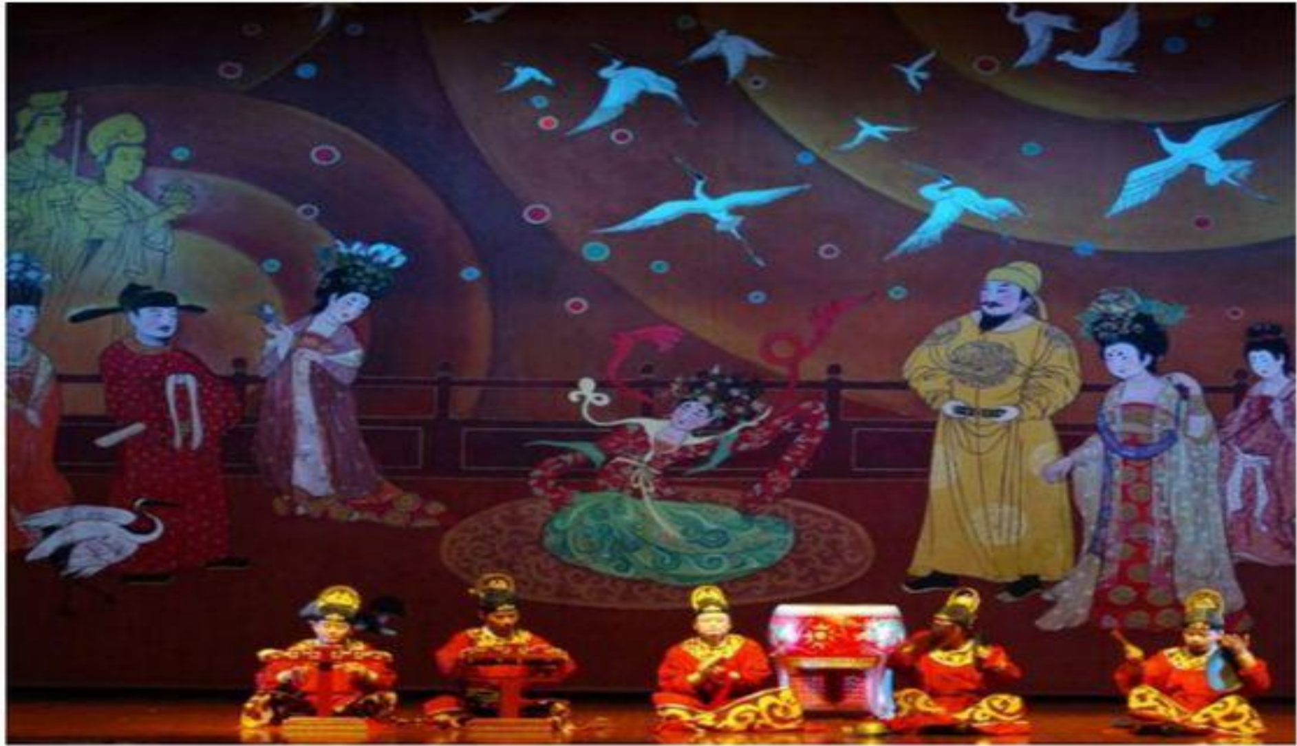
Китайский музыкальный театр.