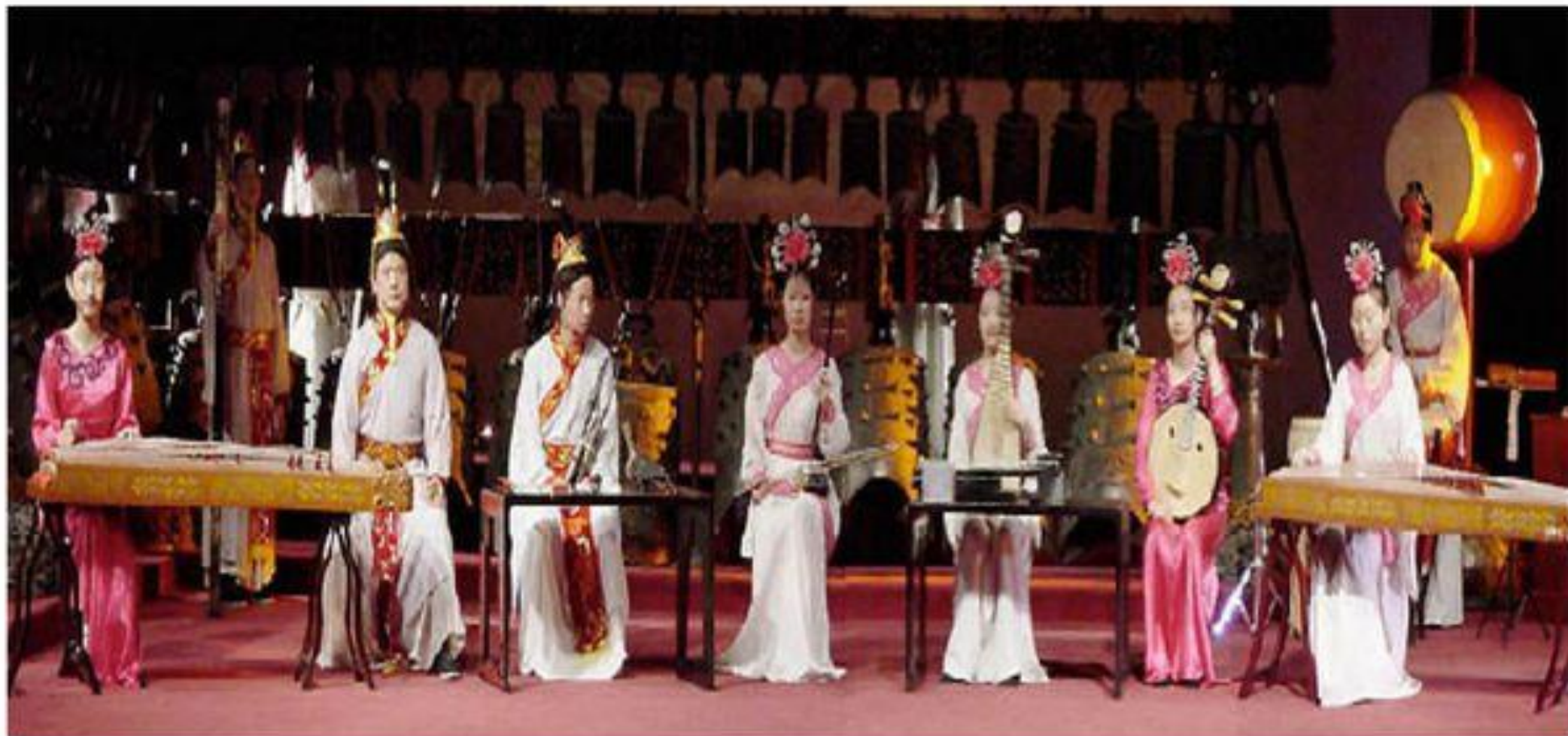
Современный китайский ансамбль народных инструментов.