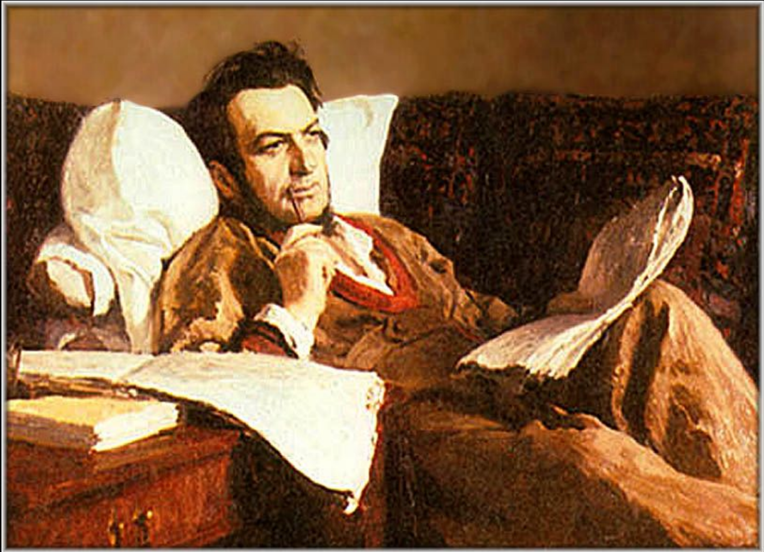
Mikhail Ivanovich Glinka (1803-1857)