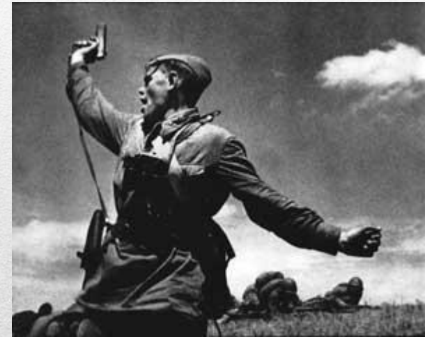
Фотография, ставшая одним из символов Великой Отечественной войны

22 июня 1941 года— началась Великая Отечественная война, музыкальным символом которой стала песня композитора Александра Александрова на стихи поэта Василия Лебедева- Кумача «Священная война» («Вставай, страна огромная»).