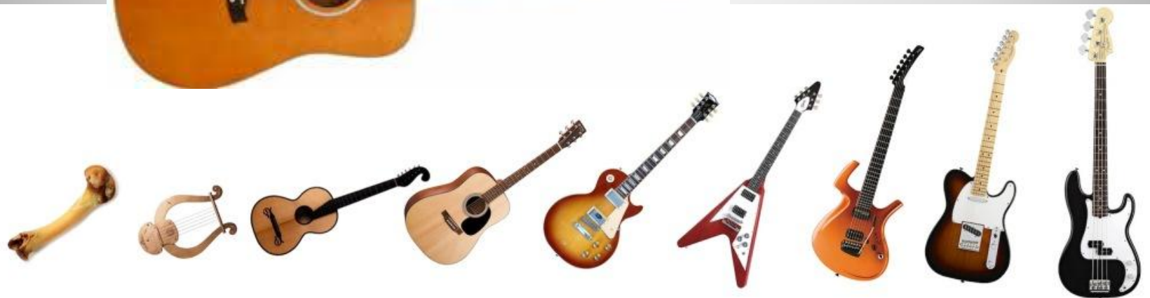
THE EVOLUTION OF THE GUITAR