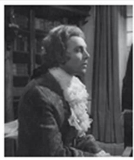
И. Смоктуновский – Сальери

Видимо, потому, что в ней разнообразно и глубоко раскрываются различные явления жизни, ее вечные темы: добро и зло, любовь и ненависть, жизнь и смерть, прекрасное и безобразное. Контрасты образов, ситуаций составляют главную движущую силу его музыки, которая помогает слушателям понять его жизненное кредо: «На любимой земле несравненно прекрасна жизнь!»