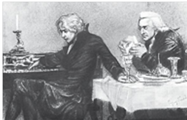
М. Врубель. Иллюстрация к трагедии А. Пушкина «Моцарт и Сальери»