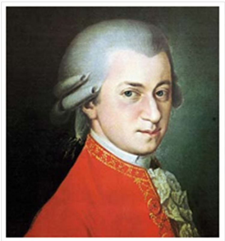
Неизвестный художник. В.А. Моцарт

Портрет любого деятеля культуры и искусства создают прежде всего его произведения: музыка, картины, скульптуры и пр., — а также его письма, воспоминания современников и художественные произведения о нем, возникшие в последующие эпохи.