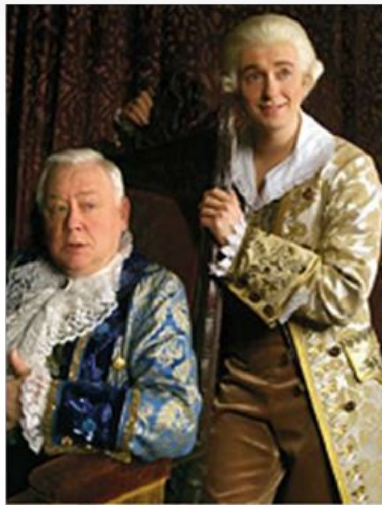
Олег Табаков – Сальери, Сергей Безруков – Моцарт

В заключительной части фильма запечатлены моменты постановки оперы «Волшебная флейта» и создания «Реквиема».