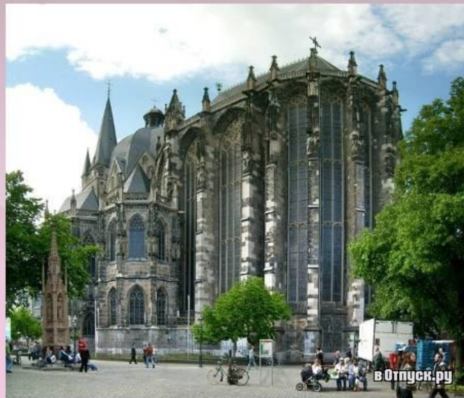
Аахенский кафедральный собор