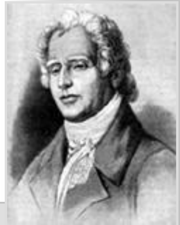
Дмитро Бортнянський (1751 - 1825)