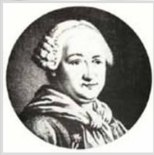
Максим Березовський (1745 - 1777)