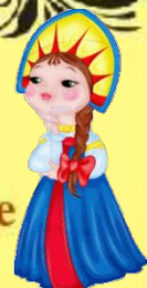
Русский академический хор имени Пятницкого