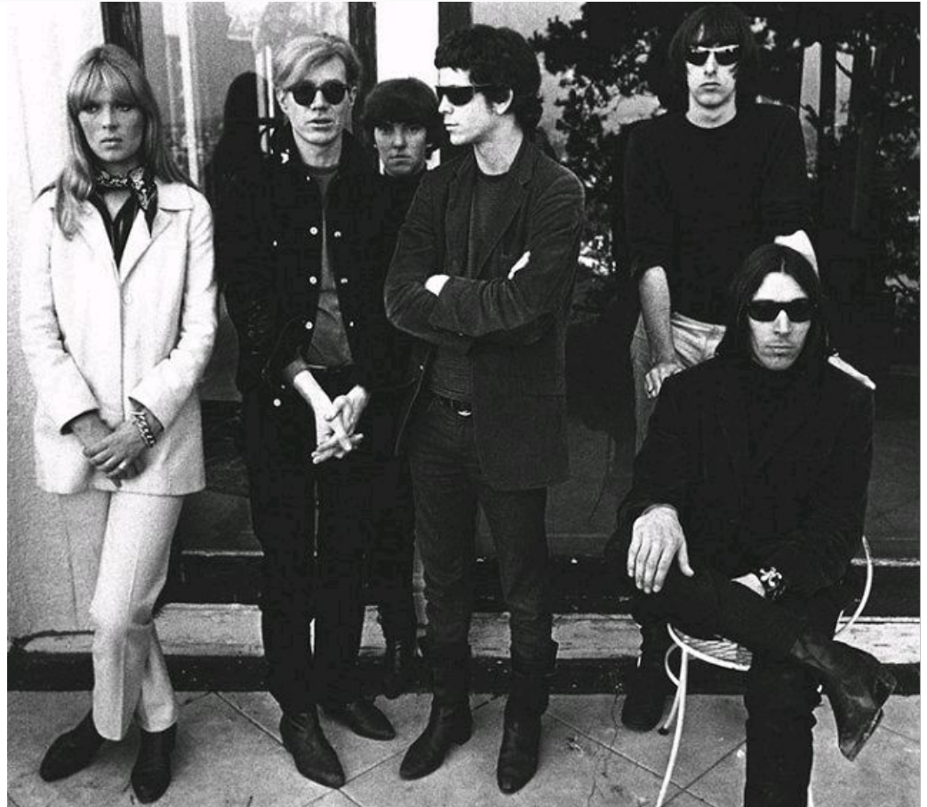
The Velvet Underground, Энди Уорхол и Нико, 1966 год

«Мало кто покупал пластинки Velvet Underground в то время, когда они выходили, но каждый, кто купил, основал свою собственную группу» - Брайан Ино (английский музыкант-электронщик, музыкальный теоретик и продюсер звукозаписи).