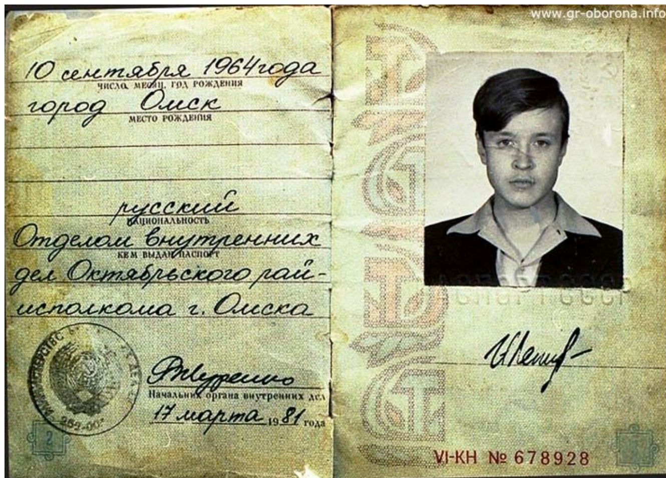
Паспорт – Егора Летова

«Гражданская оборона» считается группой, повлиявшей на формирование «Сибирского андеграунда» (направление панк-музыки, возникшее в Омске, Новосибирске, Тюмени).