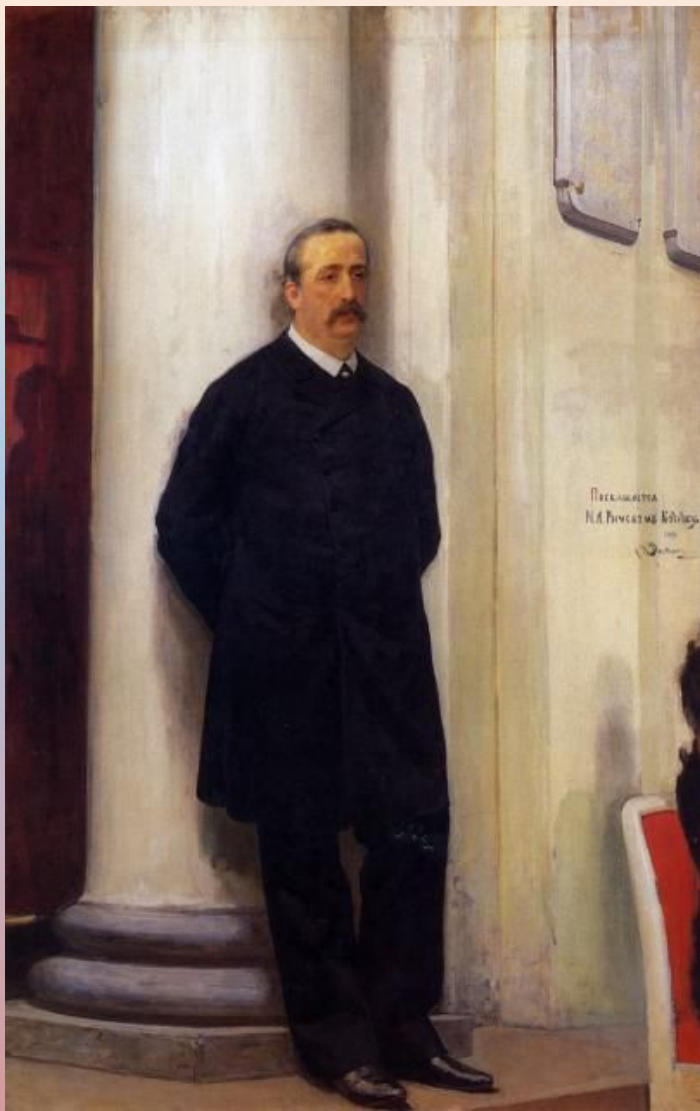
Портрет композитора и ученого-химика А.П. Бородина. Репин И.Е.

Алексей Порфирьевич Бородин (1833-1887) , будучи крупным ученым – химиком, отдавал все свое время научным исследованиям. По его собственному признанию, сочинять музыку ему приходилось лишь в период болезни. Музыкальное творческое наследие композитора невелико, но существенен вклад в развитие русской музыкальной культуры.