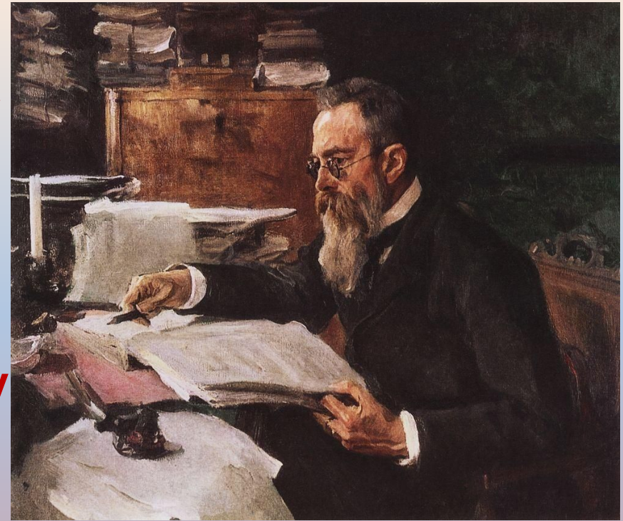
Портрет композитора Н.А.Римского- Корсакова. Серов Валентин

Позднее, в 1888г., Римский – Корсаков вновь обратился к восточным мотивам в сюите «Шехеразада» по средневековым арабским сказкам из известного сборника «Тысяча и одна ночь»