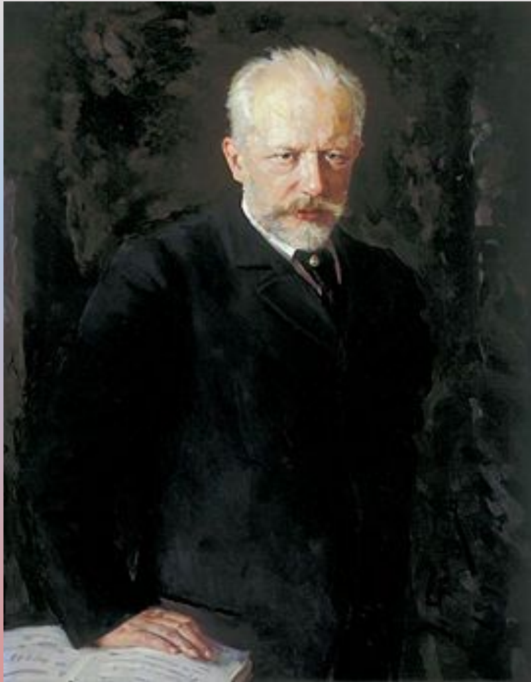
Петр Ильич Чайковский.

Всего 53 года вместила жизнь выдающегося русского композитора Петра Ильича Чайковского (1840 – 1893) , а в обширном списке созданных им произведений десять опер, три балета, девять программных симфонических произведений, концерты, квартеты, музыка к драматическим спектаклям, более ста романсов и множество других сочинений.