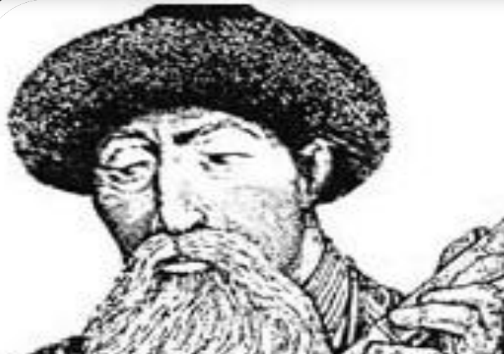
Қазанғап 1854– 1921