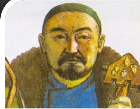
Ықылас Дүкенұлы 1843-1916