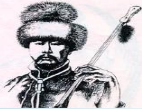
Тәттімбет Қазанғапұлы 1815-1862