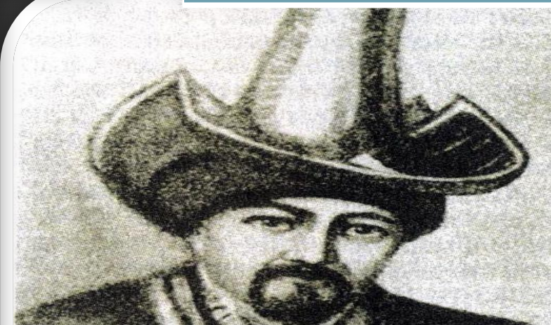
Дәулеткерей Шығайұлы 1820-1887