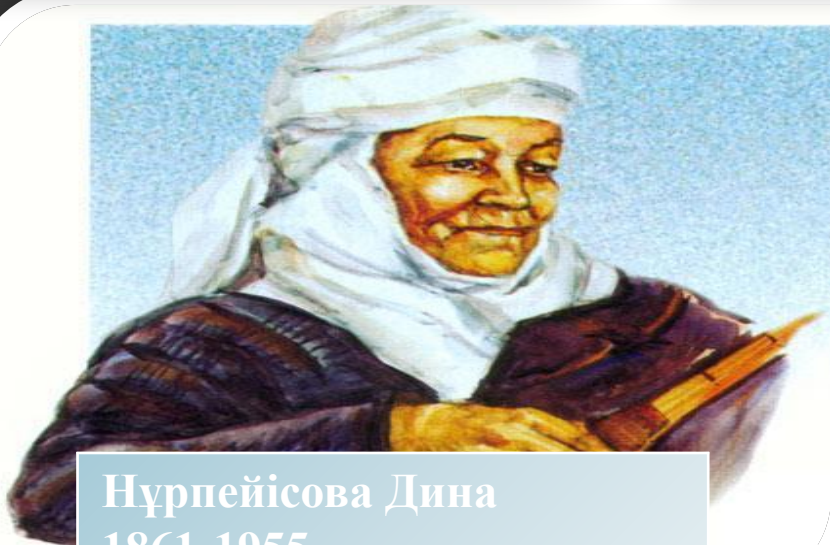
Нұрпейісова Дина 1861-1955