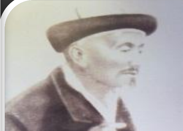
Сүгір Әлиұлы 1882 – 1961