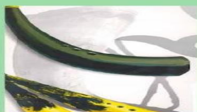
МҮЙІЗ СЫРНАЙ ҰРАН