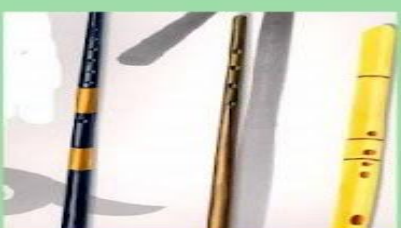
СЫБЫЗҒЫ ҚАМЫС СЫРНАЙ