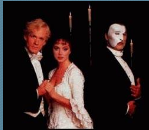
Э.Л.Уэббер мюзикл «Призрак оперы»