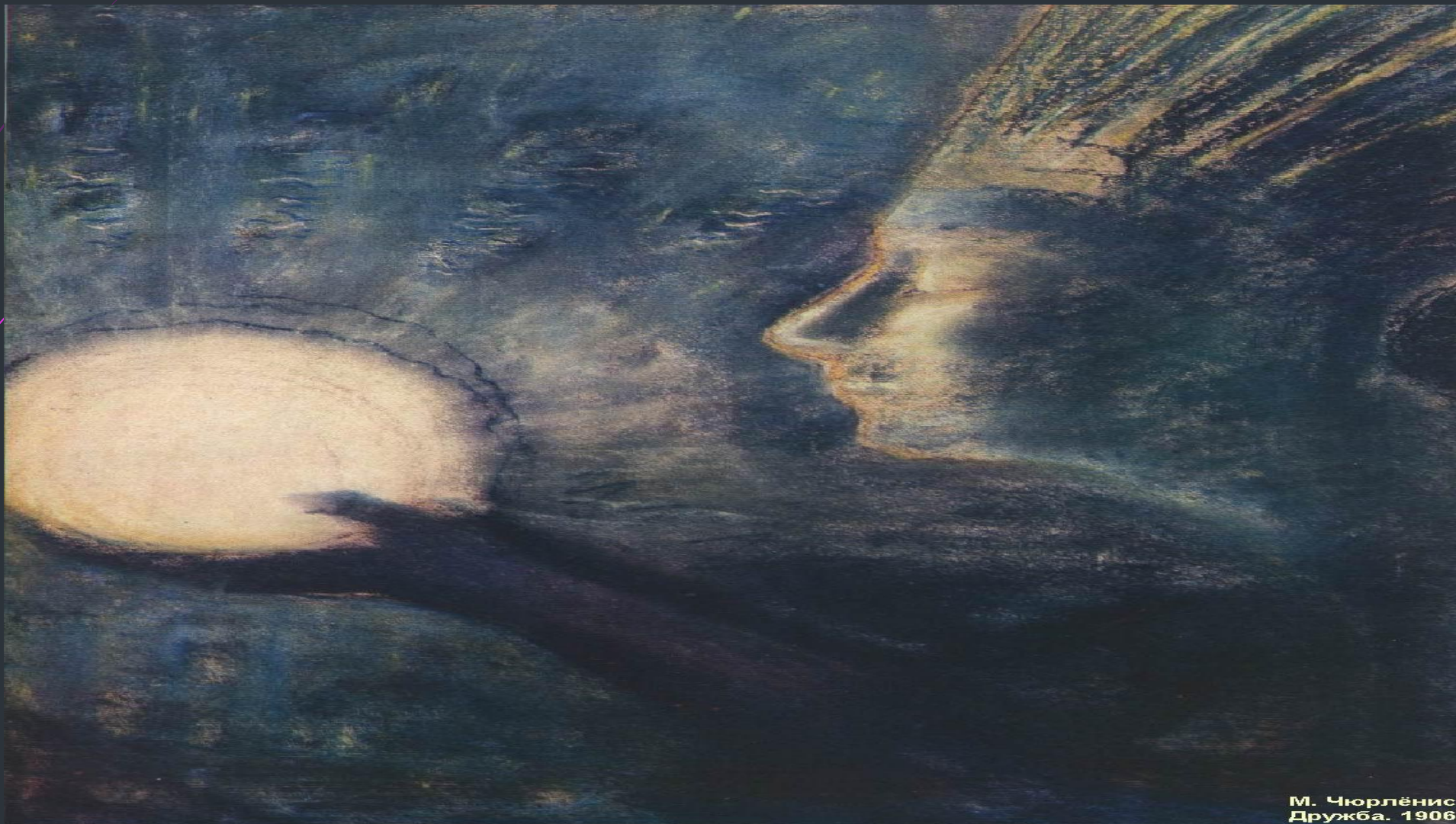
М. Чюрлёнис Дружба. 1906