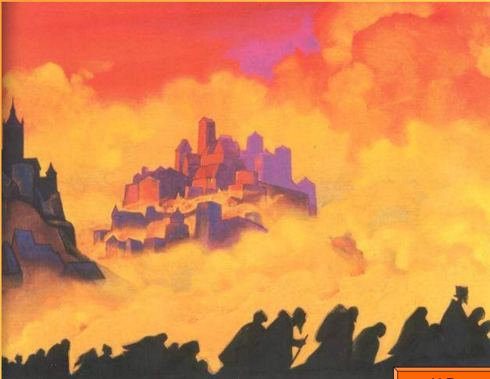
Армагеддон 1940 г. Н.Рерих