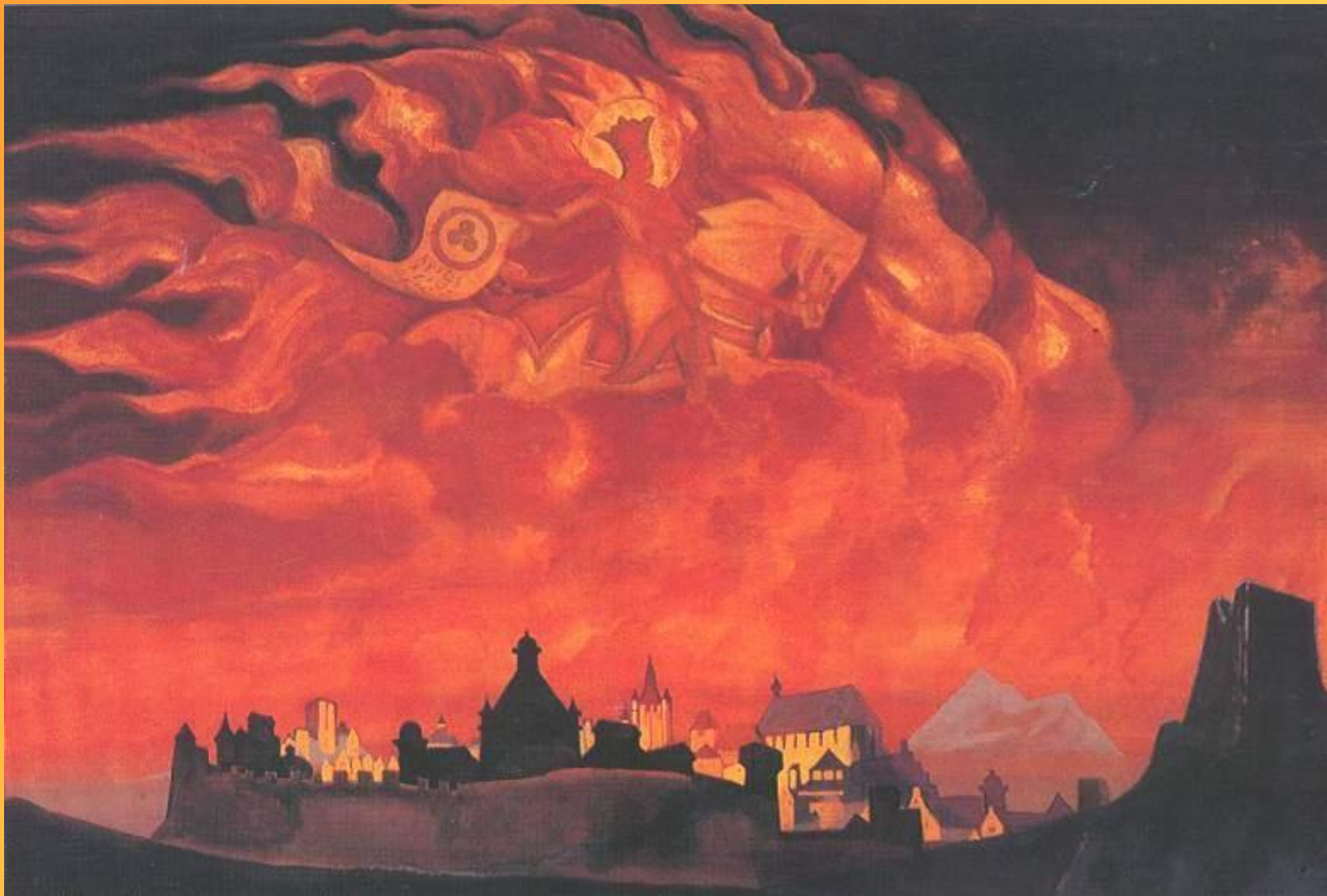
Святая София. Н. Рерих