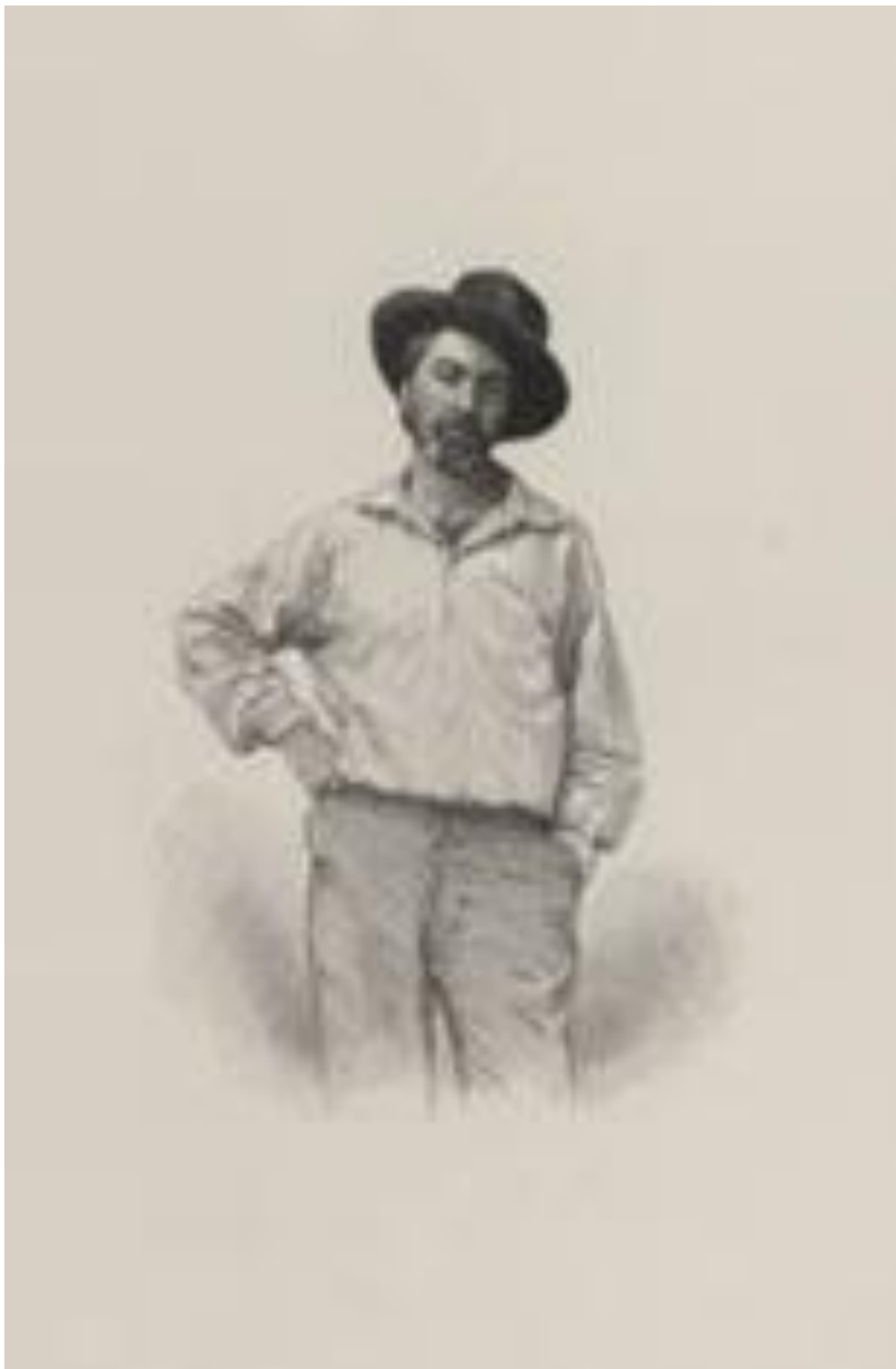
Уолт Уитмен 1819-1892