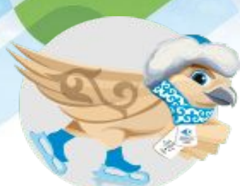
Конькимен жүгіру спорты