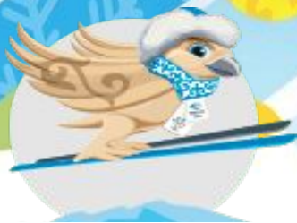
Шаңғымен трамплиннен секіру