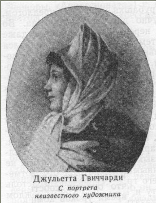
Джульетта Гвиччарди С портрета неизвестного художника