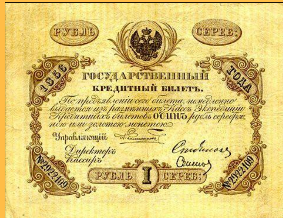
Ассигнации, появившиеся после реформы Канкрин