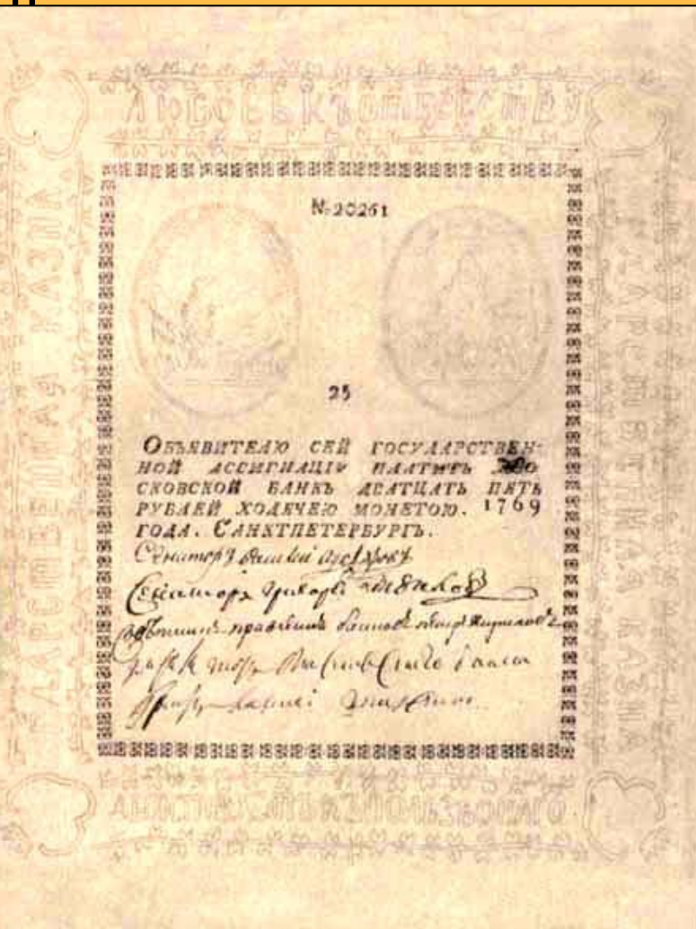
25 рублей при Екатерине II