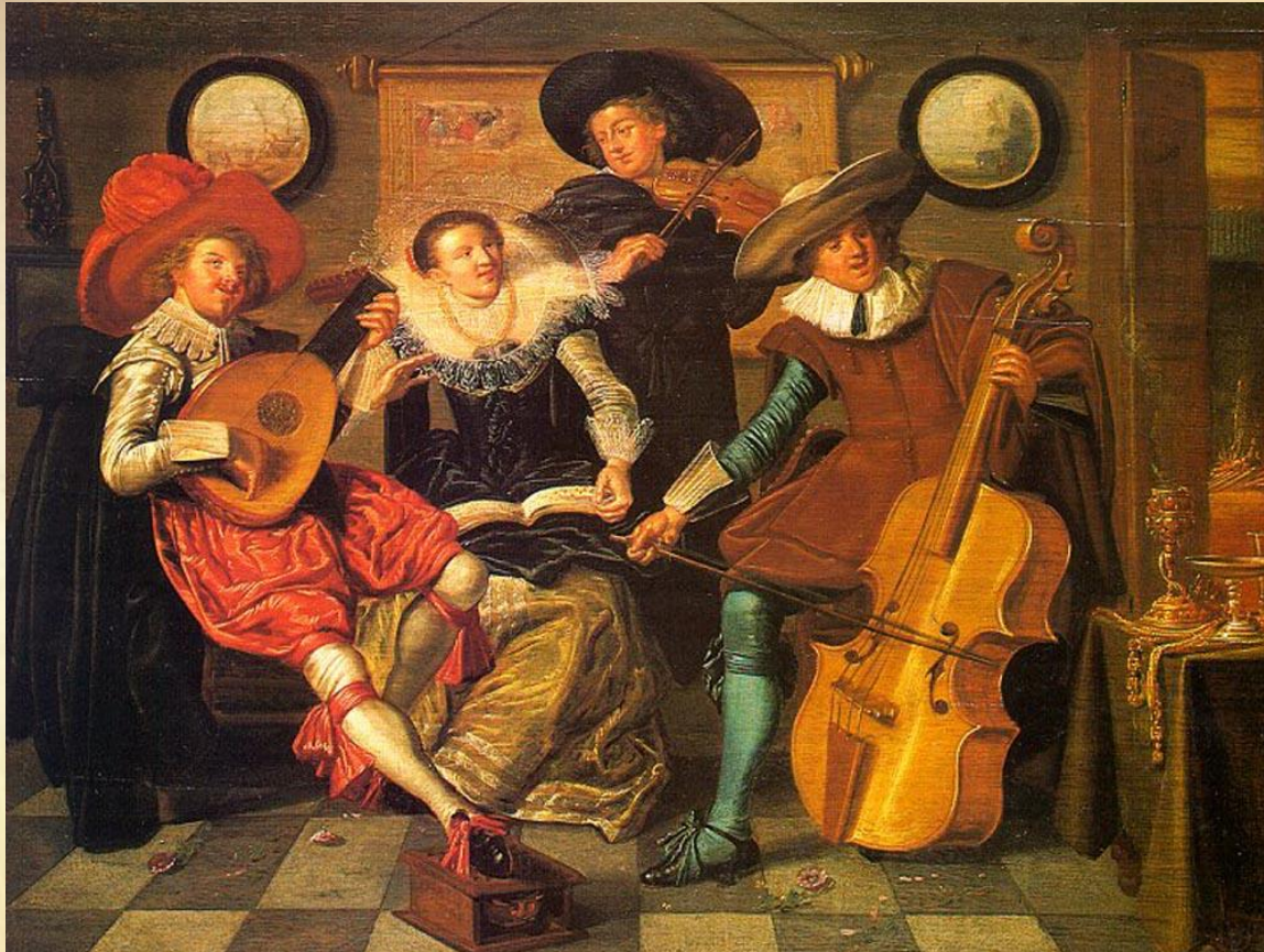
Музыка в XV веке