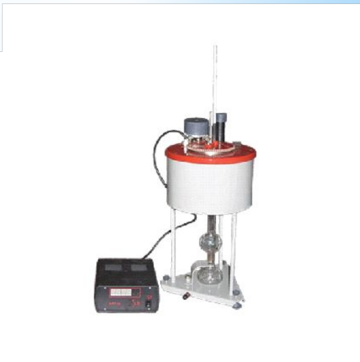
Вискозиметр для определения условной вязкости