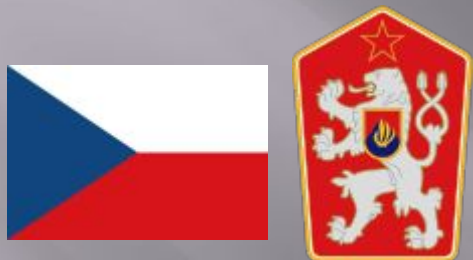
Флаг и Герб Чехии