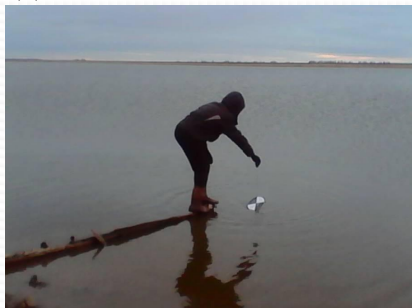
Определение РН среды

Определение солёности методом выпаривания