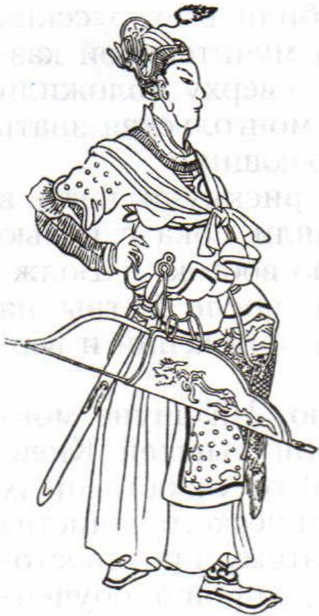
Батый. Рисунок из восточной рукописи

После победы на реке Сить монголы двинулись на Новгород, путь лежал через город Торжок, здесь они хотели пополнить свои хлебные запасы. Но жители подожгли хлебные склады. В середине марта монголы возобновили поход на Новгород, но не дошли до него сто верст. Началась весенняя распутица и армия Батыея повернула на Юг