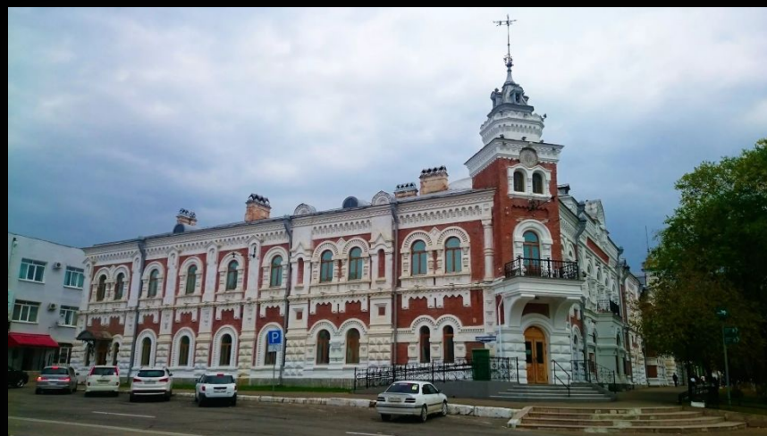
Краеведческий музей Благовещенск