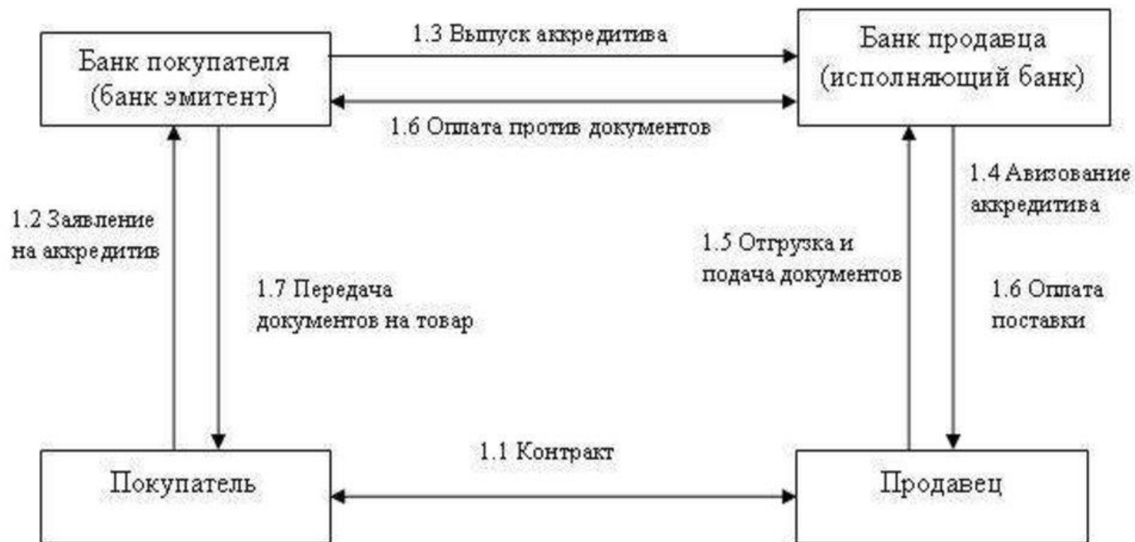
СХЕМА РАСЧЕТОВ ПО АККРЕДИТИВУ