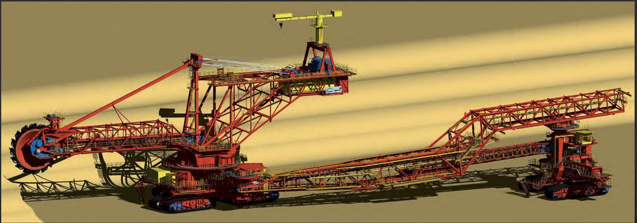
Роторный экскаватор TAKRAF