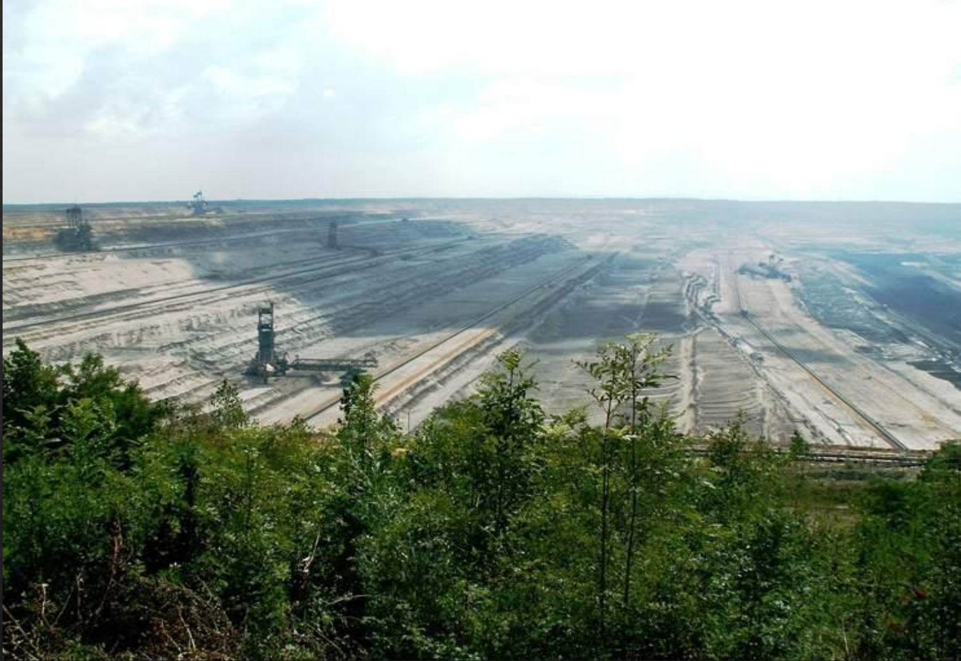
Kap'ep Tagebau Hambach