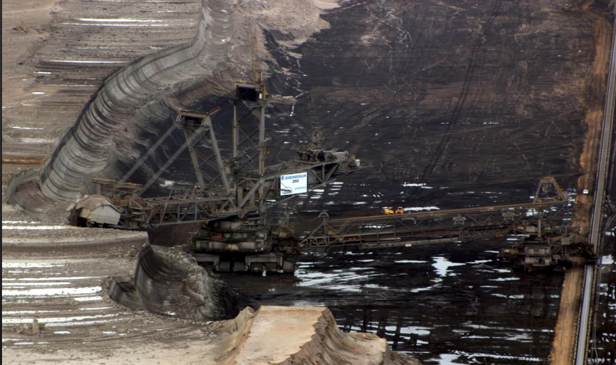
Вagger 293 під час роботи в розрізі Tagebau Hambach, 30 березня 2008 року