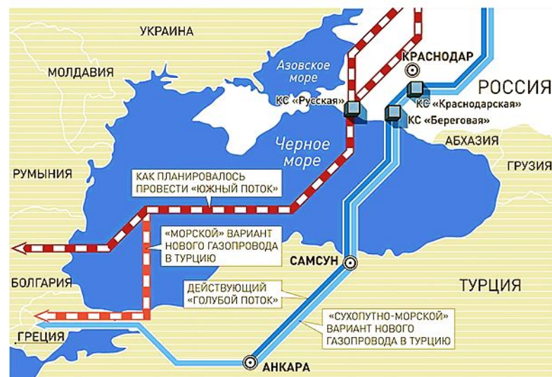
КАК МОЖЕТ ПРОЙТИ НОВЫЙ РОССИЙСКИЙ ГАЗОПРОВОД В ТУРЦИЮ