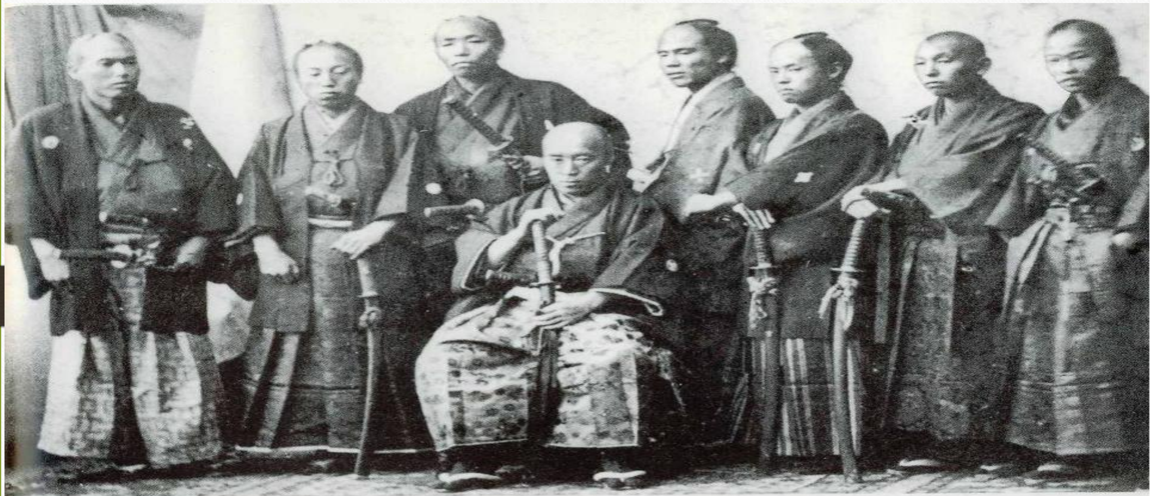
Делегация самураев в Европе (1862—1863). Посланники бакуфу должны были убедить Францию, Англию, Голландию, Пруссию и Россию в необходимости отложить на пять лет открытие для иностранцев новых гаваней и рынков на территории Японии.