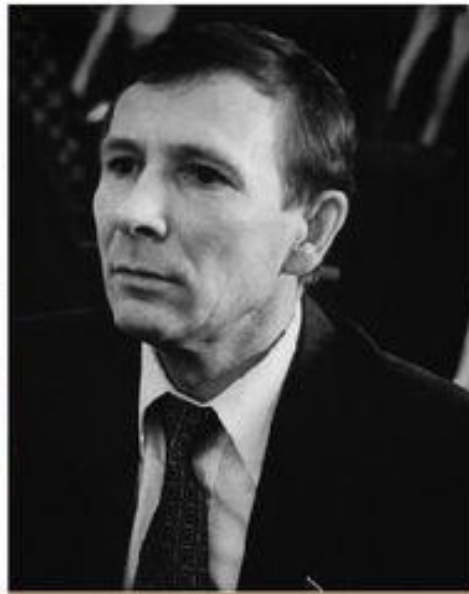
1990 г. – «Демократическая партия» Н. Травкин