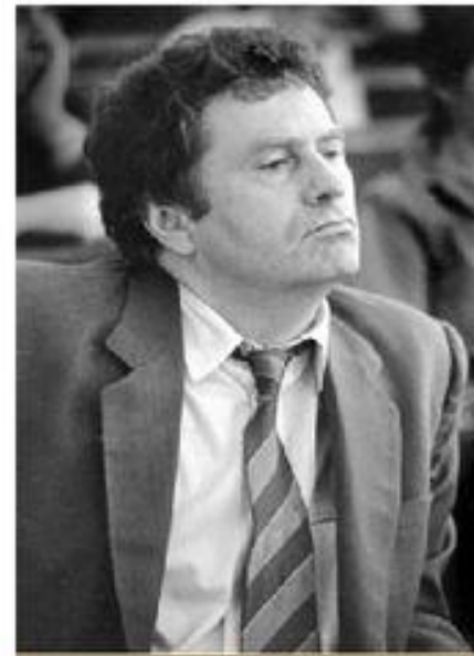
1991 г. - Либерально- демократическая партия. В. Жириновский