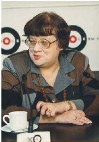
1988 г. – «Демократический союз» В. Новодворская

По мере утраты политической инициативы КПСС в стране усилился процесс формирования новых политических партий