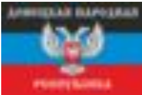
Донецкая Народная Республика