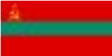
Приднестровская Молдавская Республика