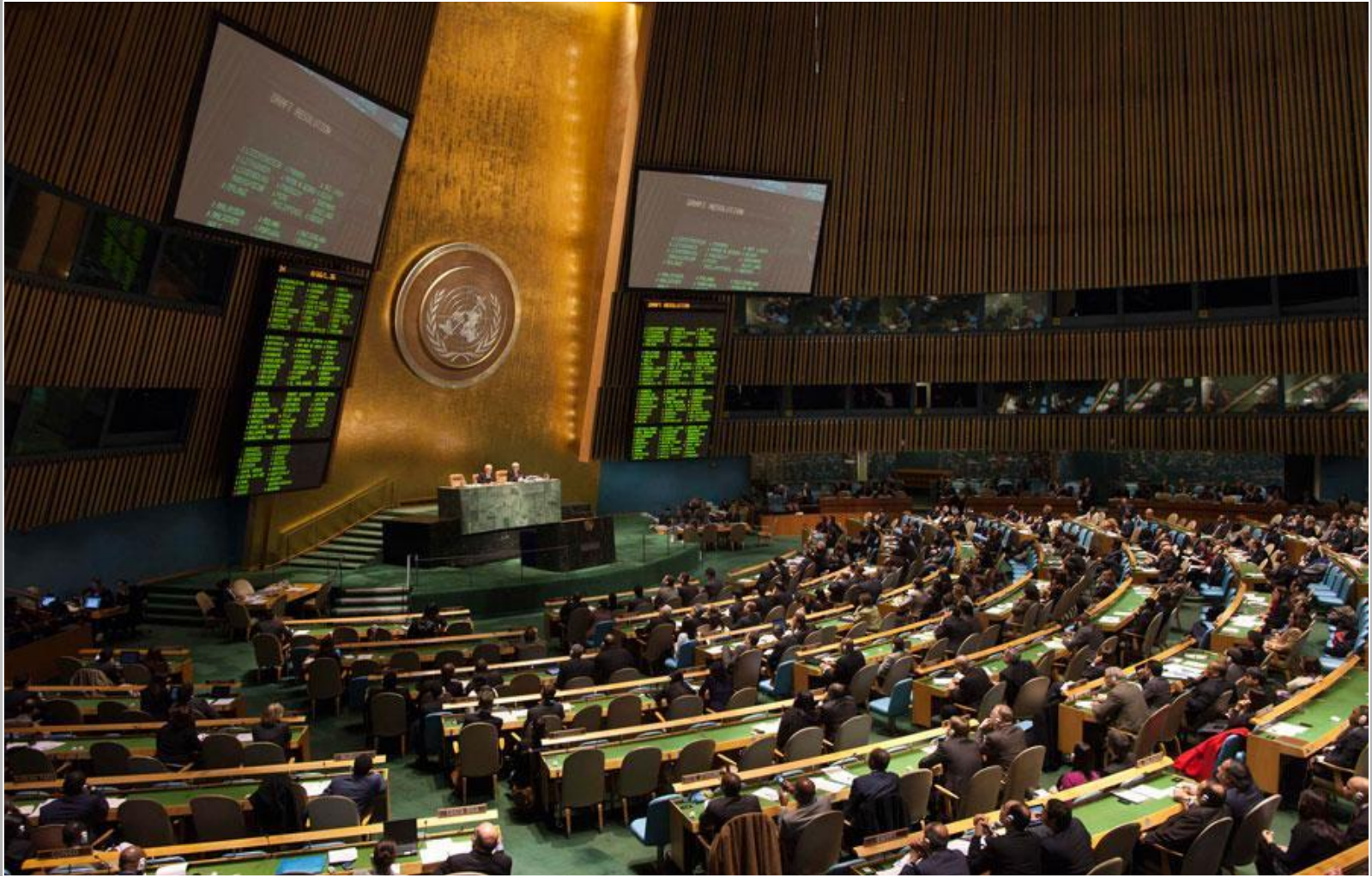
Генеральная Ассамблея ООН