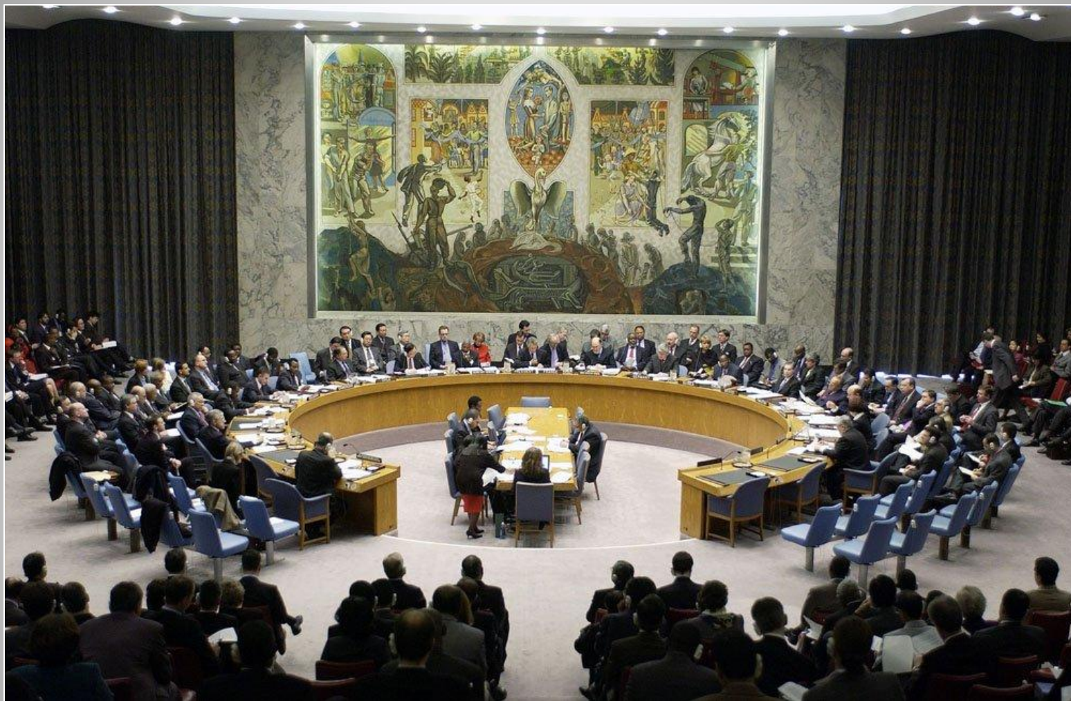
Совет Безопасности ООН